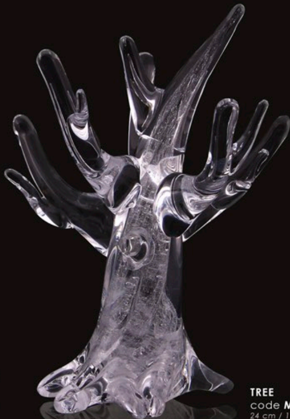
TREE code MC 18-0 24 cm / 1,0 kg

Skulptur „Tree of Memories“: Der Stamm dieses Baumes ist bis tief in seine Wurzeln mit der Asche verschmolzen. Dieser kristallene Baum der Erinnerungen ist als Familien-Set erhältlich.