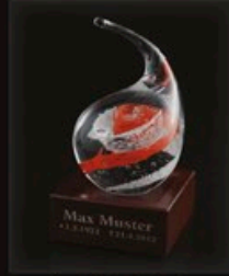
code MC 02-4 + Sockel A1-M 13 cm / 0,6 kg