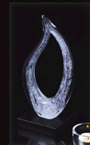
code MC 32-0 + Sockel B1-G 26 cm / 1,2 kg