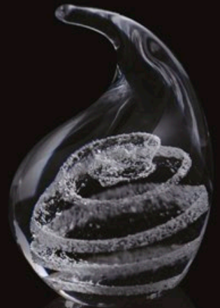
TEAR code MC 02-0 10 cm / 0,5 kg