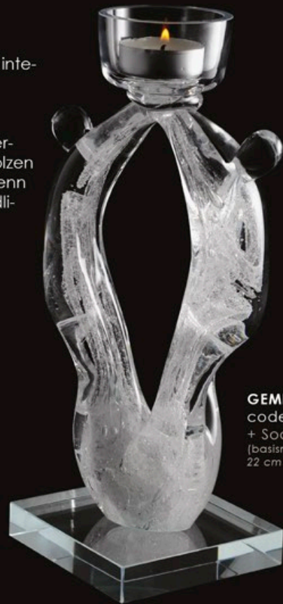
GEMINI code MC 31-0 + Sockel C1 (basismodell) 22 cm / 1,2 kg