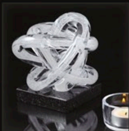
code MC 36-0 + Sockel B1-G 14 cm / 1,0 kg

Das Design "Spirit" ist ein charaktvoller Freigeist! Diese Skulptur ist mit glatter oder alternativ mit gerippter Oberfläche erhältlich.