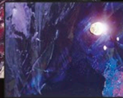
Detail mit Stern und Asche