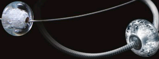
code MCK 1 18mm

„Bead“: Diese sehr elegante Glasperle ist ein von Hand gefertigtes Einzelstück - keine gleicht einer anderen! Schon allein wegen der enthaltenen und sichtbaren Aschespur ist dies wohl im wahrsten Sinne des Wortes Ihr persönlichstes Schmuckstück. Bead-Schmuck kann am Hals oder am Handgelenk getragen werden. Die Glas-Beads für das Handgelenk können mit 24 Karat Gold veredelt werden und sind zusätzlich mit einer Tülle im inneren verarbeitet. Ein Armband oder eine Kette kann zusätzlich bestellt werden.