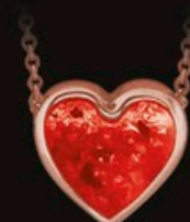
code 701 R rosa gold 14kt farbe ROT 7x7mm