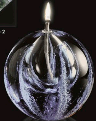
OIL LAMP code MC 20-0 11 cm / 0,8 kg