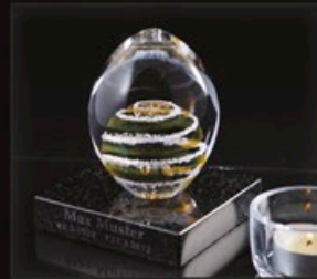
code MC 01-1 + Sockel B1-G + text 12 cm / 0,7 kg