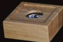
code A1-D Eiche 8 x 8 x 3 cm