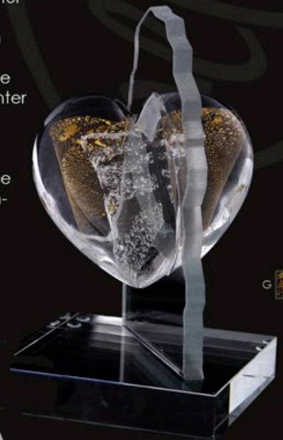
UNBREAKABLE HEART code MC 19-G 17 cm / 1,2 kg