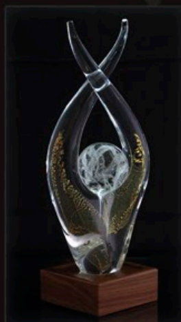
code MC 34-G + Sockel A1-AO 27 cm / 1,0 kg

Das Design "Spirit" ist ein charaktvoller Freigeist! Diese Skulptur ist mit glatter oder alternativ mit gerippter Oberfläche erhältlich.