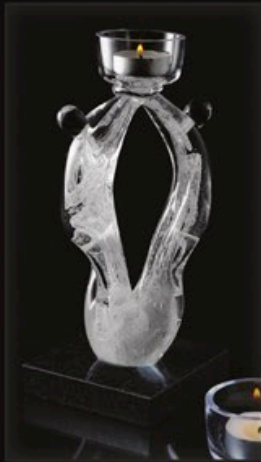
code MC 31-0 + Sockel B1-G 22 cm / 1,2 kg

Aufgrund seiner Formgebung könnten sogar zwei verschiedene Aschen getrennt voneinander verschmolzen werden, aber doch in dieser Skulptur vereint sein, wenn Sie es wünschen. Auch die Kombination unterschiedlicher Farben ist möglich.