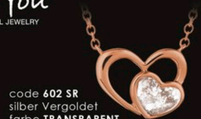
code 602 SR silber Vergoldet farbe TRANSPARENT 14x11mm