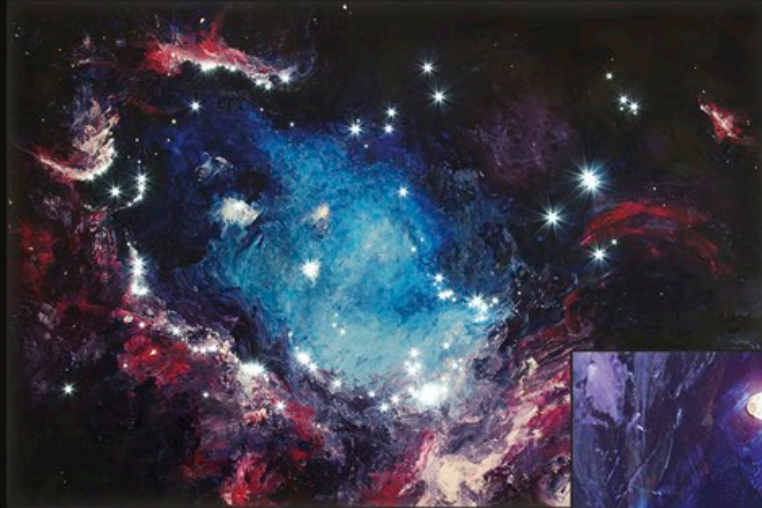
code GM-1 90 x 60 x 10 cm (100 Sterne)