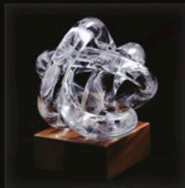
code MC 36-0 + Sockel A1-AO 15 cm / 1,0 kg