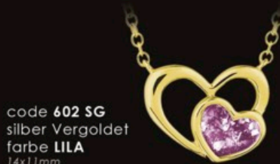
code 602 SG silber Vergoldet farbe LILA 14x11mm