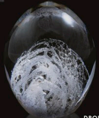
DROP code MC 05-0 10 cm / 0,5 kg