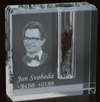
code MC V-1 9 x 9 x 3 cm