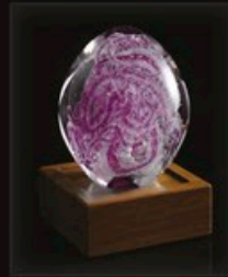
code MC 05-7 + Sockel A1-D 13 cm / 0,6 kg