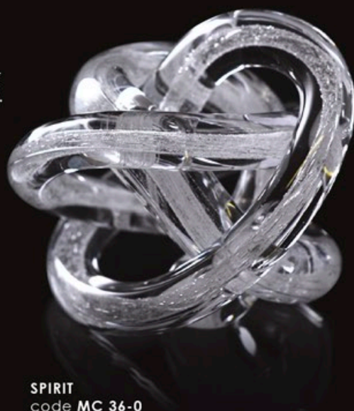
SPIRIT code MC 36-0 14 cm / 1,0 kg (Standardlieferung mit Sockel C1)