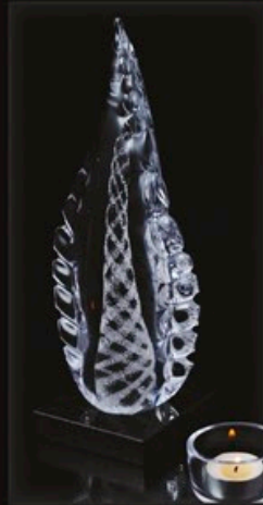
code MC 35-0 + Sockel B1-G 26 cm / 2,0 kg