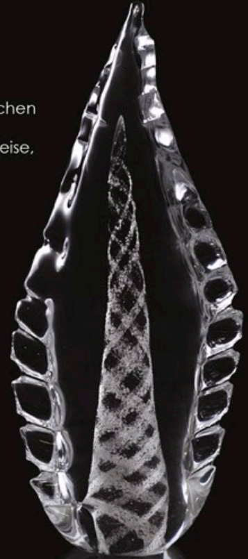
DESTINY code MC 35-0 26 cm / 1,8 kg (Standardlieferung mit Sockel C1)