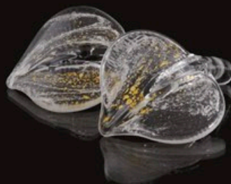
GOLDEN LEAF code MC 08-G 8 cm / 0,1 kg (nur ein Stück)

Jedes einzelne „Golden Leaf“ wird in einer edlen Aufbewahrungs-Box aus Holz geliefert.