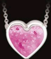
code 701 S silber 925/1000 farbe ROSA 7x7mm