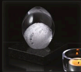
code MC 05-0 + Sockel B1-G 12 cm / 0,7 kg