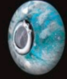
code MCK 2-3 18x10mm