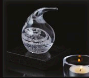
code MC 02-0 + Sockel B1-G 12 cm / 0,7 kg