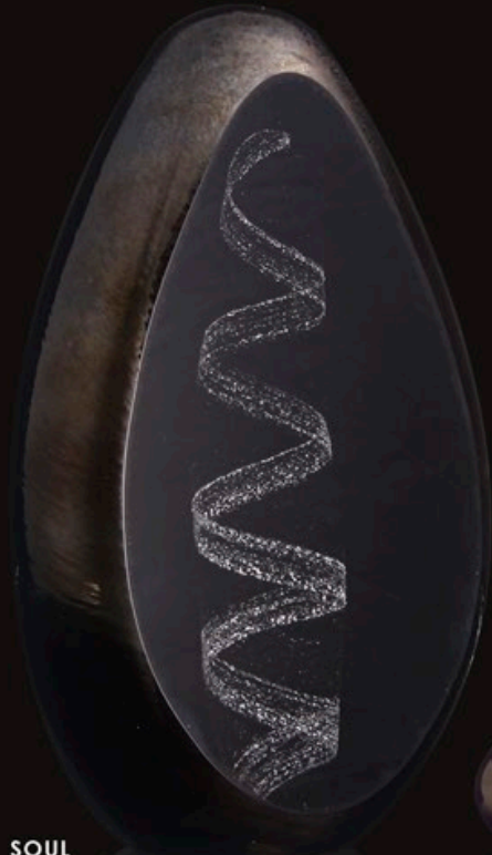
SOUL code MC 37-0 20 cm / 2,5 kg (Standardlieferung mit Sockel C1)

Die Kristalloberfläche ist schwarz mit einem irisierenden Effekt. Nur die geschliffene Vorderseite erlaubt es uns, diese wohlbehütete „Seele“ zu betrachten.