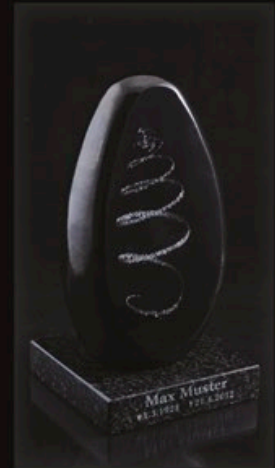
code MC 37-0 + Sockel B1-G + text gravur 20 cm / 2,0 kg