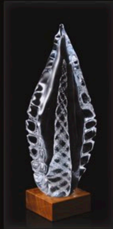
code MC 35-0 + Sockel A1-D 27 cm / 1,9 kg

Erinnerungskristalle sind eine einzigartige Kombination aus feinstem böhmischen Qualitätskristallglas mit einer kleinen Menge verschmolzener und sichtbarer Kremationsasche eines geliebten Verstorbenen. Die respektvolle Art und Weise, wie wir während des gesamten Prozesses mit der uns anvertrauten Asche umgehen, sind die Grundpfeiler unseres Erfolges.