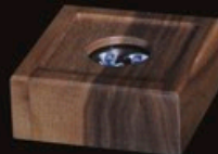
code A1-AO Walnuss 8 x 8 x 3 cm