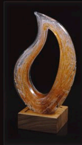
code MC 32-1 + Sockel A1-D 27 cm / 1,0 kg