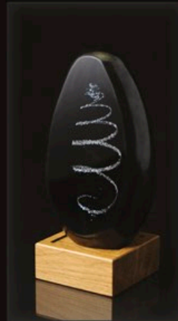
code MC 37-0 + Sockel A1-D 21 cm / 1,8 kg