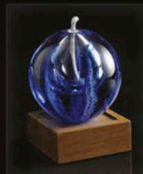
code MC 20-3 + Sockel A1-D 14 cm / 0,9 kg