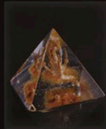
code MC 10-1 10 cm / 0,5 kg