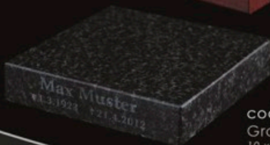
code B1-G Granit 10 x 10 x 2 cm