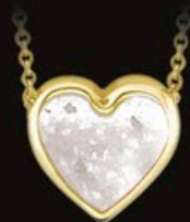
code 701 G gelb gold 14kt farbe WEIß 7x7mm