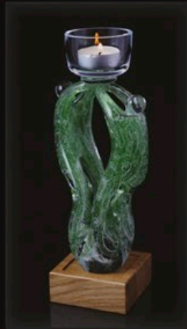
code MC 31-2 + Sockel A1-D 23 cm / 1,0 kg