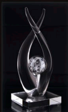
code MC 34-0 + Sockel C1 26 cm / 1,2 kg