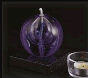
code MC 20-6 + Sockel B1-G 13 cm / 1,0 kg