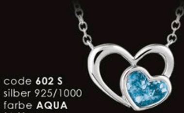
code 602 S silber 925/1000 farbe AQUA 14x11mm