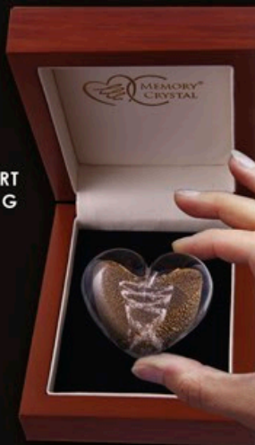
GOLDEN HEART code MC 07-G 6 cm / 0,2 kg

Die Kristallherzen sind mit 24 Karat Gold veredelt. Durch ihre bauchige Form passen diese kleinen „Seelen-tröster“ perfekt in die Handfläche.