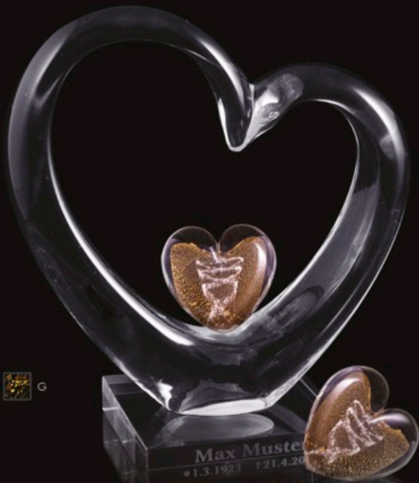
HEART IN HEART code MC 17-G + Sockel C1 (Basismodel) + text gravur 22 cm / 1,2 kg

Skulptur „Heart in Heart“ und Skulptur „Unbreakable Heart“ sind echte Statements! Diese goldene Herzen sind starke Symbole der Liebe. Sie eignen sich hervorragend als echte Familien-Sets – auch für die entfernter lebenden Angehörigen.