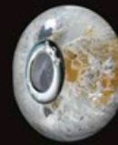
code MCK 2-G 18x10mm Gold 24kt