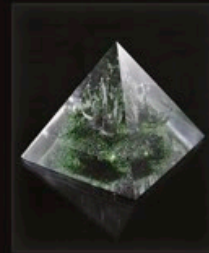
code MC 10-2 10 cm / 0,5 kg