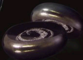
STONE code MC 09-0 5 cm / 0,1 kg (nur ein Stück)