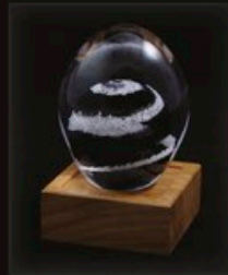
code MC 01-5 + Sockel A1-D 13 cm / 0,6 kg