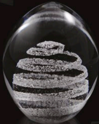
DROP code MC 01-0 10 cm / 0,5 kg

Die Kollektion „Classik“ besteht aus einer großen Auswahl kleinerer Erinnerungskristalle in verschiedenen Formen und Farben und Sie sind immer einschließlich der verschmolzenen Asche erhältlich. (Sockel und Teelichthalter können nach Wahl bestellt werden.)