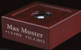
code A1-M Mahagoni 8 x 8 x 3 cm